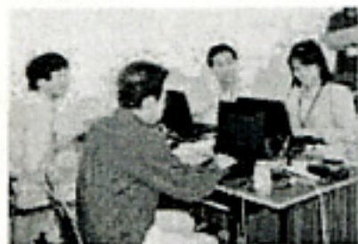
ノートPCのインストール等には日曜日の19時限を設けた。