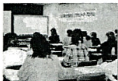
参加者は20～30代の企業で働く女性たちが多い。